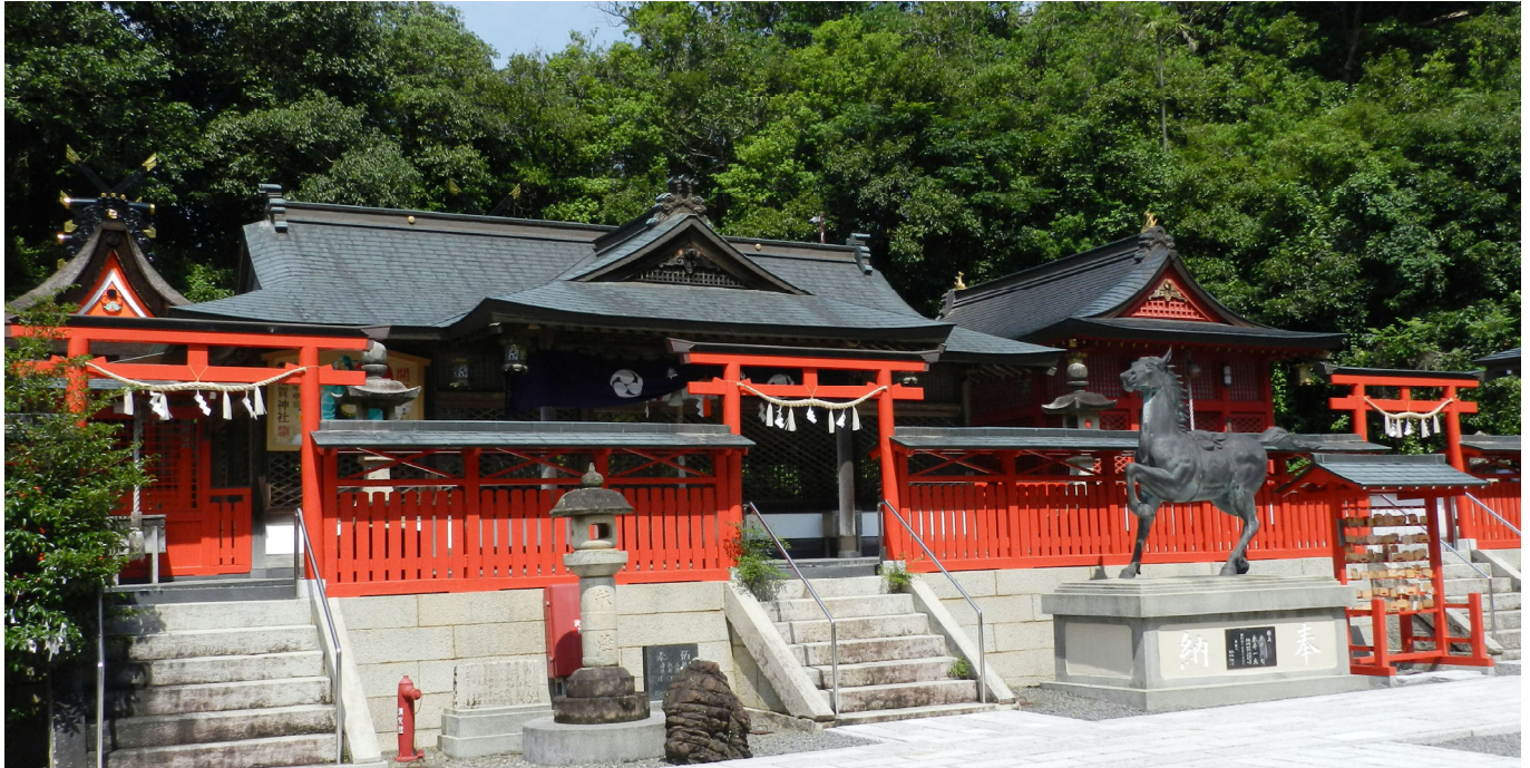
須賀神社(日高郡みなべ町)