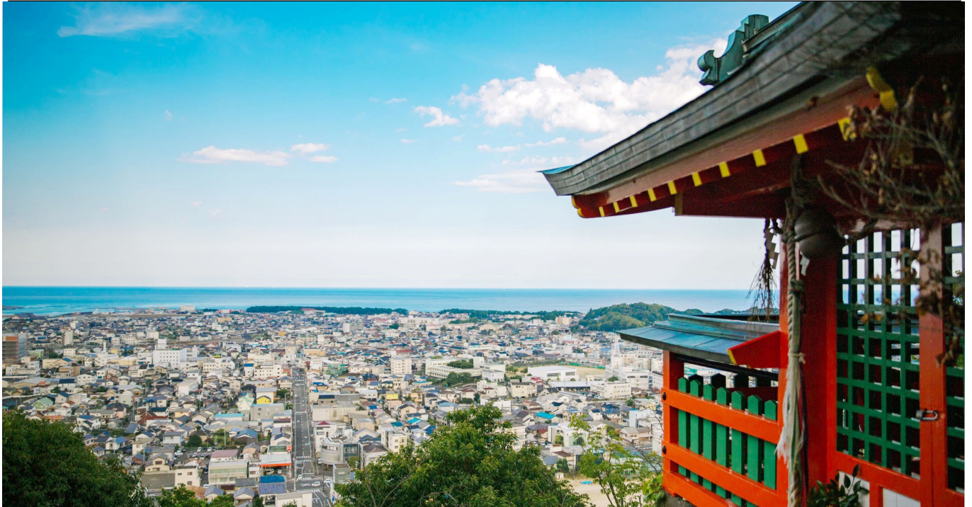
神倉神社から見える新宮の景色

発行所 和歌山県行政書士会 発行日 令和5年8月27日 〒640-8155 和歌山市九番丁1番地(中谷ビル2F) TEL 073-432-9775・FAX 073-432-9787 E-mail waka_gyosei@galaxy.ocn.ne.jp URL http://www.g-wakayama.org/